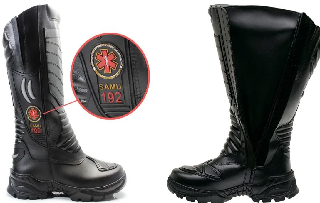
Imagem meramente ilustrativa modelo de Bota SAMU:

A EMPRESA QUE GANHAR A LICITAÇÃO DAS BOTAS PEDIMOS QUE MANDEM A PRÓPRIA BOTA PARA QUE SEJAM FEITAS AS PROVAS. NÃO ACEITAREMOS OUTRO TIPO DE MODELO PARA A PROVA.