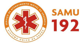
Imagem meramente ilustrativa modelo de macacão SAMU: