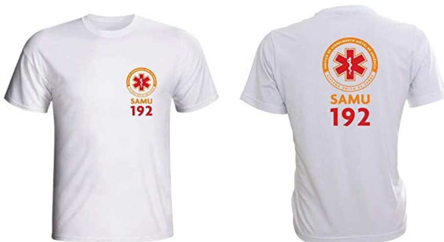
Imagem meramente ilustrativa modelo de camiseta SAMU:

A EMPRESA QUE GANHAR A LICITAÇÃO DAS CAMISETAS PEDIMOS QUE MANDEM A PRÓPRIA CAMISETA PARA QUE SEJAM FEITAS AS PROVAS. NÃO ACEITAREMOS OUTRO TIPO DE MODELO PARA A PROVA.