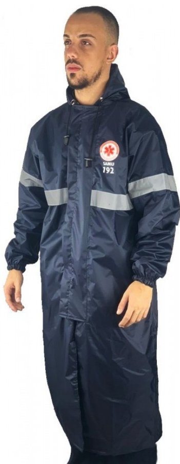
Imagem meramente ilustrativa modelo de Capa de Chuva SAMU:

A EMPRESA QUE GANHAR A LICITAÇÃO DA CAPA DE CHUVA PEDIMOS QUE MANDEM A PRÓPRIA CAPA DE CHUVA PARA QUE SEJAM FEITAS AS PROVAS. NÃO ACEITAREMOS OUTRO TIPO DE MODELO PARA A PROVA.