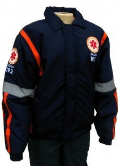
Imagem meramente ilustrativa modelo de Jaqueta SAMU:

A EMPRESA QUE GANHAR A LICITAÇÃO DAS JAQUETAS PEDIMOS QUE MANDEM A PRÓPRIA JAQUETA PARA QUE SEJAM FEITAS AS PROVAS. NÃO ACEITAREMOS OUTRO TIPO DE MODELO PARA A PROVA.