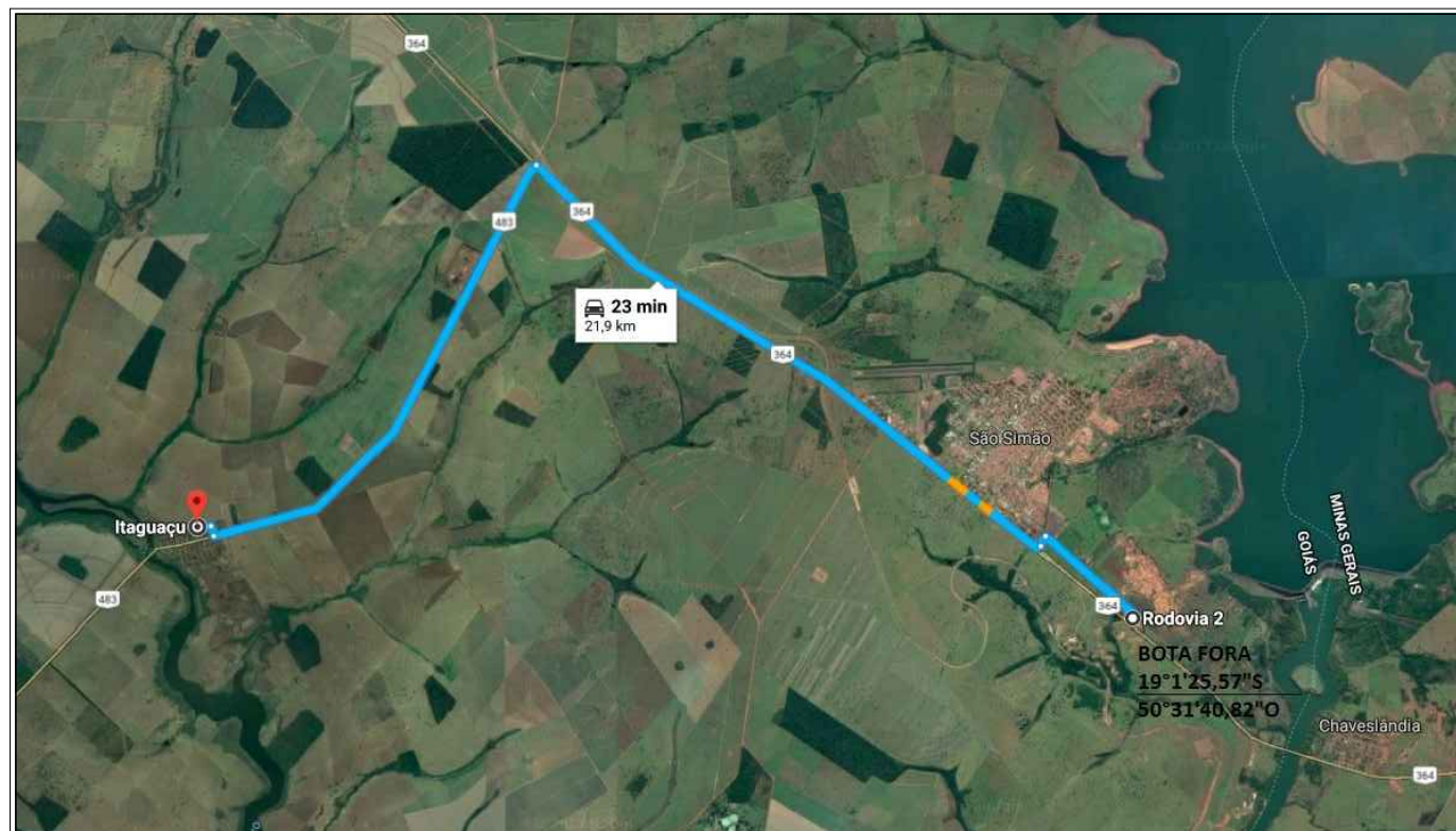
DMT BOTA-FORA SEM ESCALA